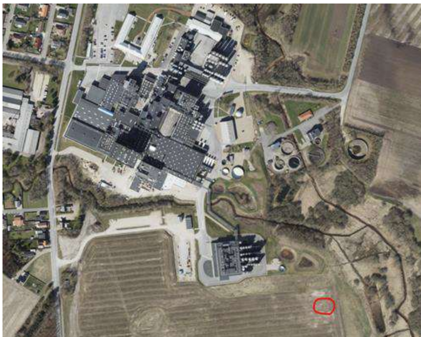
Figur 1. Område der skal grundvandssænkes er markeret med rød klamme.

Ringkøbing-Skjern Kommune modtog den 23. september 2024 ansøgning om nedsivning på ejendommen Mælkevejen 4, 6920 Videbæk. Området, der skal grundvandssænkes, er markeret på oversigtskort i figur 1.