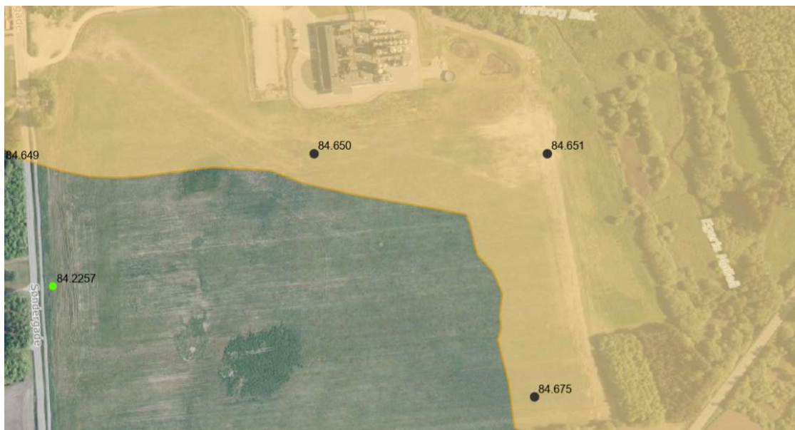
Figur 4. Område beskyttet mod vandindvinding. Aktive boringer er angivet med grøn prik. Sorte prikker er sløjfede boringer.

Nærmeste indvindingsboring er markvandingsboring med DGU nr. 84.2257 ca. 400 meter vest for grundvandssænkningen. Boringen indvinder fra 33 til 45 meters dybde og forventes ikke påvirket af den midlertidige grundvandssænkning.