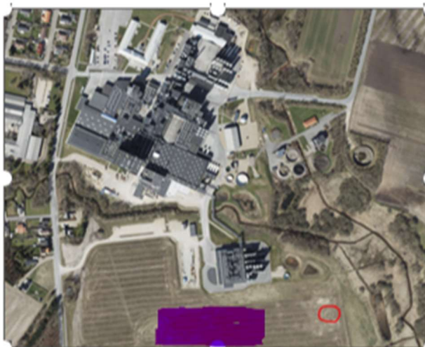
Figur 3. Areal for nedsivning er markeret med blå markering.

Ansøgningen angiver, at grundvandet er rent, og at der dermed ikke er risiko for forurening.