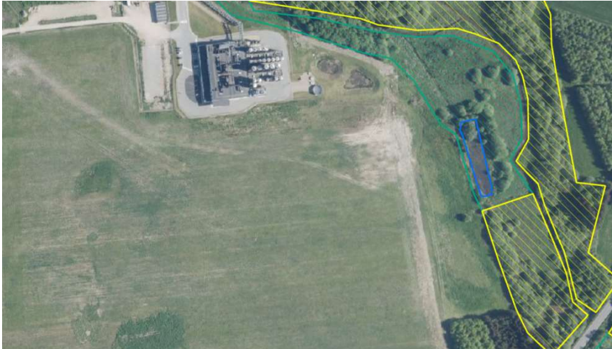
Figur 5. Beskyttede naturtyper tæt på projektet eng (grøn), mose (gul), sø (blå).